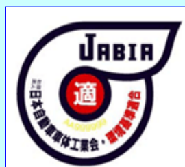
環境基準適合ラベル