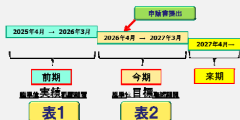
表1と表2に記入する「期間」と表相互の関係(前:管理年度が4月~翌年3月までの場合)